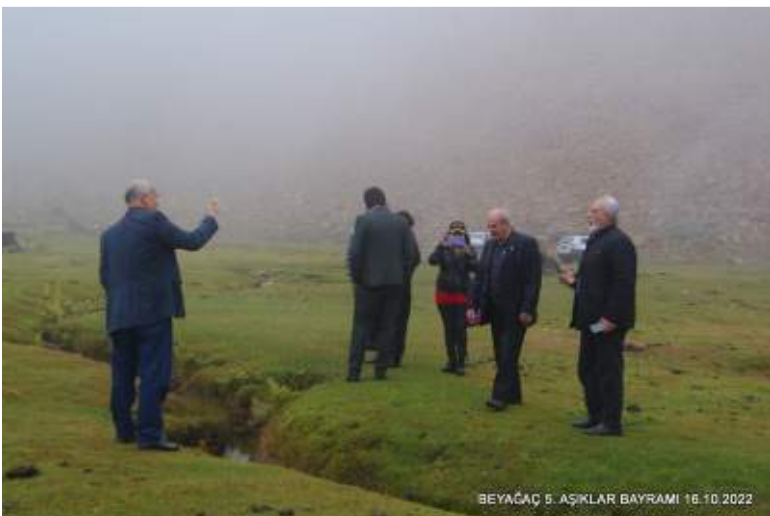
BEYAĞAÇ 5. AŞIKLAR BAYRAMI 16.10.2022

KAYNAK: "Doğadan Nadide Bir Armağan/BEYAĞAÇ" Broşürü