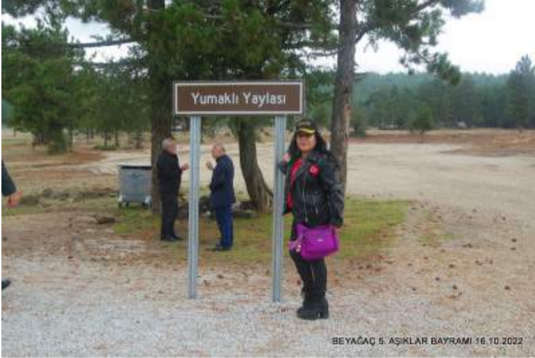
BEYAĞAÇ 5. AŞIKLAR BAYRAMI 16.10.2022

ve kızıl kayalıklarla çevrilidir. Az sayıdaki anıt karaçam ağacı da sanki gölün bekçileri gibidirler. Bölgenin adıyla ilgili çok şey anlatılır. Ancak en mantıklı olanı, yüksek bir bölge olması ve daha yenilere kadar yolun olmaması nedeniyle çevredeki ağaçlarda ve kayalıklarda kartalların yaşaması, burada yuva yapıp yavrulamaları nedeniyle "KARTAL GÖLÜ" adını aldığıdır. Bölge, "ANIT ORMANLAR/KARTAL GÖLÜ" olarak isim yapmıştır. Haziran ayı ortalarından sonra gününbirlik piknik alanı ve çadırli ziyaret maksadıyla kullanılabilir. Konumu gereği oldukça ilginç bir görünüm sunar. Baharda karlar tümden erimeden önce yamaçlardaki parça parça bembeyaz karların, çevredeki yemyeşil karaçam ağaçlarının, pırlıl pırlıl göl sularının ve masmavi gökyüzünün fotoğrafçılar için vazgeçilemez, efsanevi bir görüntüsü vardır. Her yıl Ağustosun son perşembesi EREN' de olduğu gibi burada da "EREN GÜNÜ" yapılır. Çadırlar, kurulur, sabahlara kadar Meydan Ateşleri yakılır... Buradan EREN' e yürünerek 35-45 dakikada varılabilir. Biz daha önce burada 'EREN GÜNÜ' nde birkaç kez geceledik... Bir de burada altın bir kartal heykelinin bulunduğu efsanesinden dolayı zaman zaman defineciler tarafından sık sık göl tabanının kazıldığını görürüz. Hatta bir ara gölün suyunu boşaltmak için batı kısımdaki alçak kısmın kazılarak göl suyunun boşaltılmaya çalışıldığı görüldü. Burası doldurularak göl suları tekrar eski seviyesine yükseltildi. Salık veririz, mutlaka gelip görülmeli, mümkünse geceleymeli...